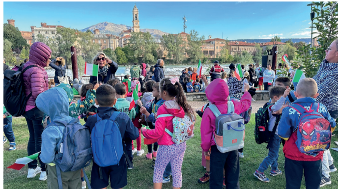
IN FESTA Gli alunni delle scuole presenti allo Stadio della Canoa